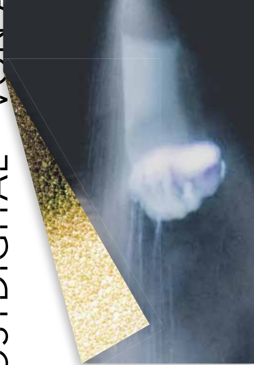
Frank Homeyer, AU (Ausschnitt), 2016, Performance, Fotografie