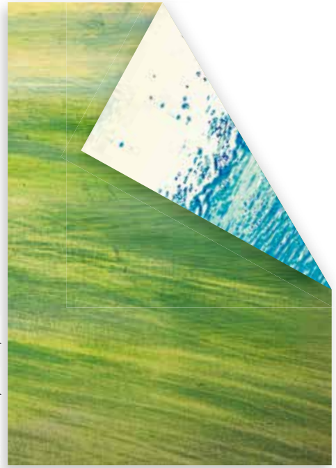
Katrin Roth, GREEN FIELD #030718 (Ausschnitt), 2018, Öl auf Karton, 70 x 50 cm, © VG Bild-Kunst, Bonn 2019, Foto: K. R.